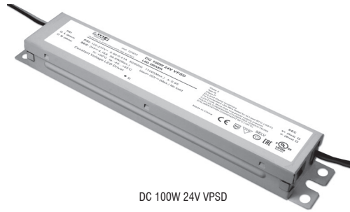
DC 100W 24V VPSD