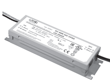
DC 60W 24V VPSD